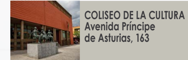
COLISEO DE LA CULTURA Avenida Príncipe de Asturias, 163