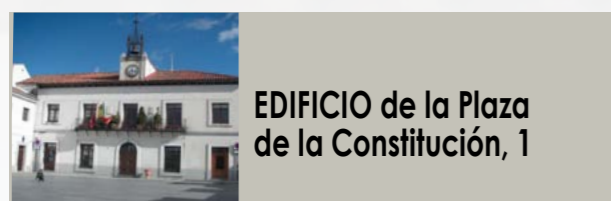
EDIFICIO de la Plaza de la Constitución, 1