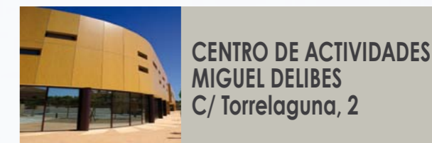
CENTRO DE ACTIVIDADES MIGUEL DELIBES C/ Torrelaguna, 2