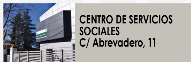
CENTRO DE SERVICIOS SOCIALES C/ Abrevadero, 11