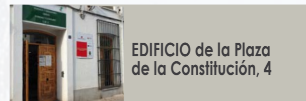
EDIFICIO de la Plaza de la Constitución, 4

Debido a la gran demanda de peticiones de cita a través del teléfono, se recomienda el uso del correo electrónico