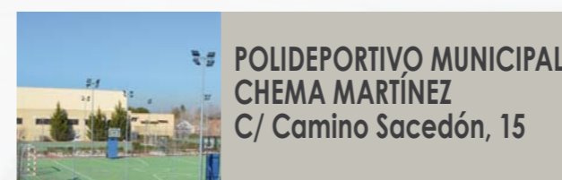
POLIDEPORTIVO MUNICIPAL CHEMA MARTÍNEZ C/ Camino Sacedón, 15